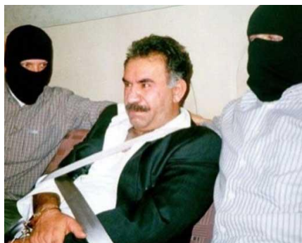
عبدالله اوجالان در میان کماندهای ترکیه که او با هواپیمای مخصوصی از کنیا به ترکیه انتقال دادند

در پایان این بیانیه آمده است: «در بیست و ششمین سال توطئه بین‌المللی، ما از مردم، دوستان و بشریت می‌خواهیم که با قوت بیش‌تری از رهبر آپو صیانت کنند و کارزار بین‌المللی را که در ۲۰ اکتبر وارد دومین سال خود می‌شود، گسترش دهند.»