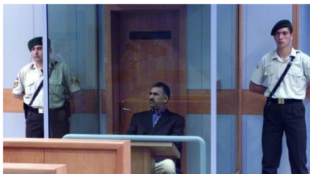
اوجلان در دادگاه نظامی استانبول

تاکنون علاوه بر مردم آزادی‌خواه، هنرمندان، شهرداری‌ها، اتحادیه‌های کارگری بریتانیا، اتحادیه‌های کارگری اسکاتلند، سیاست‌مداران، آکادمیسین‌ها، حقوق‌دانان، روشنفکران و برندگان جایزه نوبل و غیره، افراد زیادی در این کارزار شرکت کرده‌اند و آن را گسترش می‌دهند. در واقع مردم حق‌طلب و آزادی‌خواه کرد و بسیاری از آزادخواهان به‌همراه نیروهای انترناسیونالیست جهان این کارزار گسترش می‌دهند و پیش می‌برند. این هم یک موفقیت برای مردم کرد است. و هم تلاشی برای آزادی آپو!